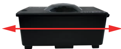
POSIZIONAMENTO ORIZZONTALE A PAVIMENTO

La vaschetta rigida in dotazione è stata progettata e studiata per agevolare la risalita del roditore fino all'esca rodenticida. La vaschetta è facilmente rimovibile per semplificare la manutenzione dell'erogatore.