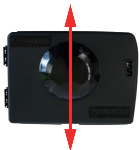
POSIZIONAMENTO VERTICALE A PARETE

Design tutelato tramite deposito comunitario