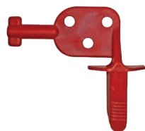
chiave specifica per apertura e chiusura