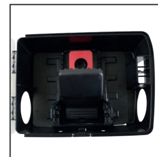
Trappola a scatto

La versione dotata della specifica vaschetta collante di 15 x 12,5 cm, realizzata in plastica termoformata, consente di effettuare un servizio di derattizzazione attraverso la cattura dei roditori. La vaschetta può essere alloggiata sul fondo della postazione, dotato di specifici punti di riferimento che conferiscono stabilità alla vaschetta. Per tutelare il benessere animale è possibile utilizzare una trappola a scatto del tipo THOR-XL.